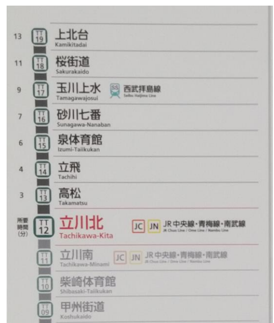
路線図部（立川北駅の例）