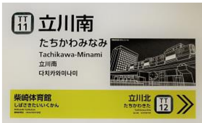
ホーム駅名標（立川南駅の例）

駅名標部分については4か国語表記とし、各駅の特徴や風景にちなんだ版画風のイラストをデザインとして取り入れました。また、路線図部分にナンバリング表示を加えるなど、すっきりとわかりやすい表記にしました。